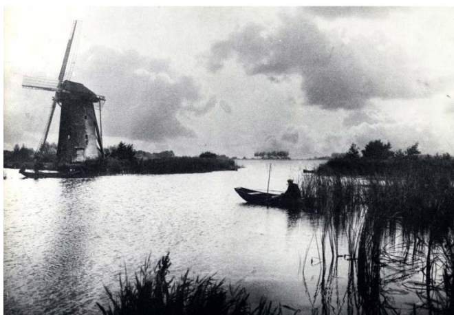
Nieuwkoop in vroeger jaren